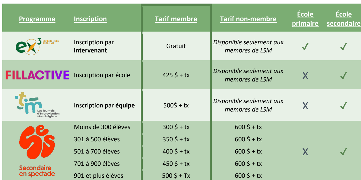
Tableau synthèse des programmes et services